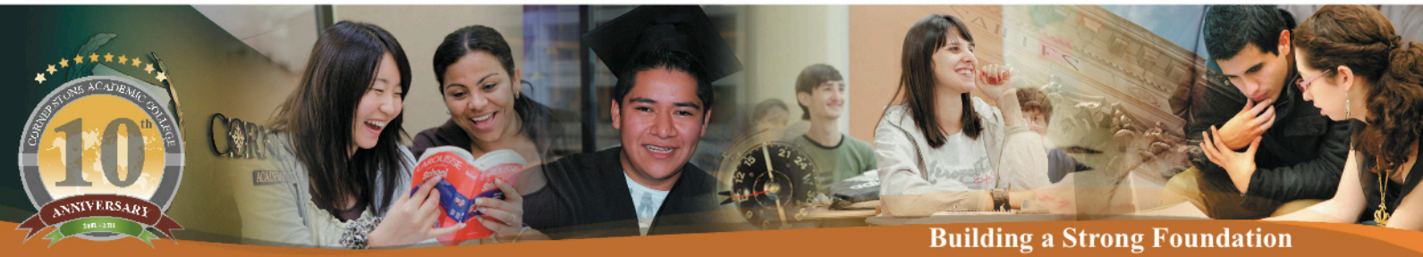
Building a Strong Foundation