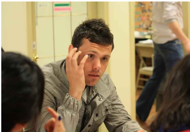
超少人数制なのでたくさん発言できるのが人気の理由!

クラスメートも先生も数週間ごとに変わるようになっていきますので、いろいろなレベルの生徒や違う先生たちとたくさん話しをするチャンスでもあります。毎日の会話のテーマとしては、カルチャーショック、思い出の映画、理想的なデート、尊敬する歴史上の人物などなど内容は多岐に渡ります。こうして様々なテーマについて話しあうことにより、通常の授業では思いもつかなかった疑問や表現の仕方など、新しい発見がたくさんうまれてくるのですね。レッスン中の間違いは先生が随時指摘してくれますし、そのつどメモをとっておいてくれます。1時間のカンバセーションクラブが終わった時点でそのメモを全員分コピーをして配ってくれるので、帰宅してからも見直しができるのはうれしいですね。