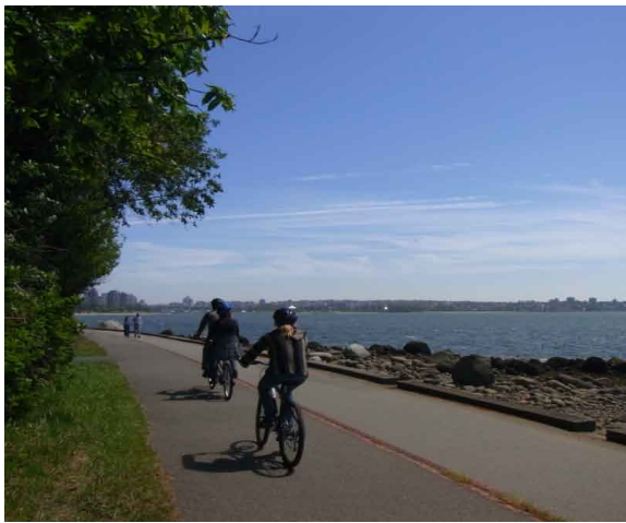
こんな景色を眺めながらのサイクリングは最高です!